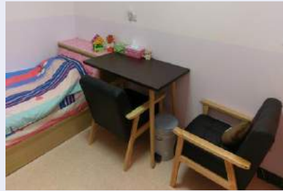
新增桌/沙發/置物櫃及圍簾提供母性同仁更為隱私的空間