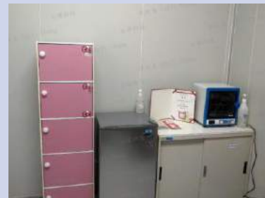
置物櫃/消毒鍋/奶瓶清潔劑使用