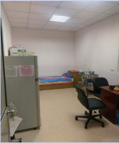
地板/天花板/牆壁更新