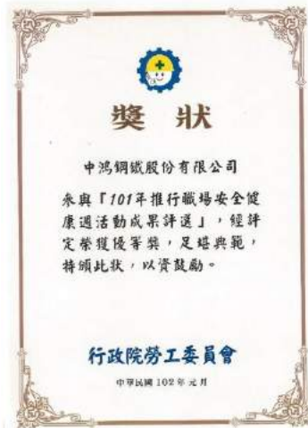
榮獲推動職場安全健康週活動-「優等獎」