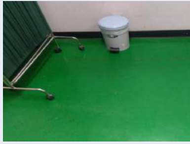
地板綠色有煙灰痕跡